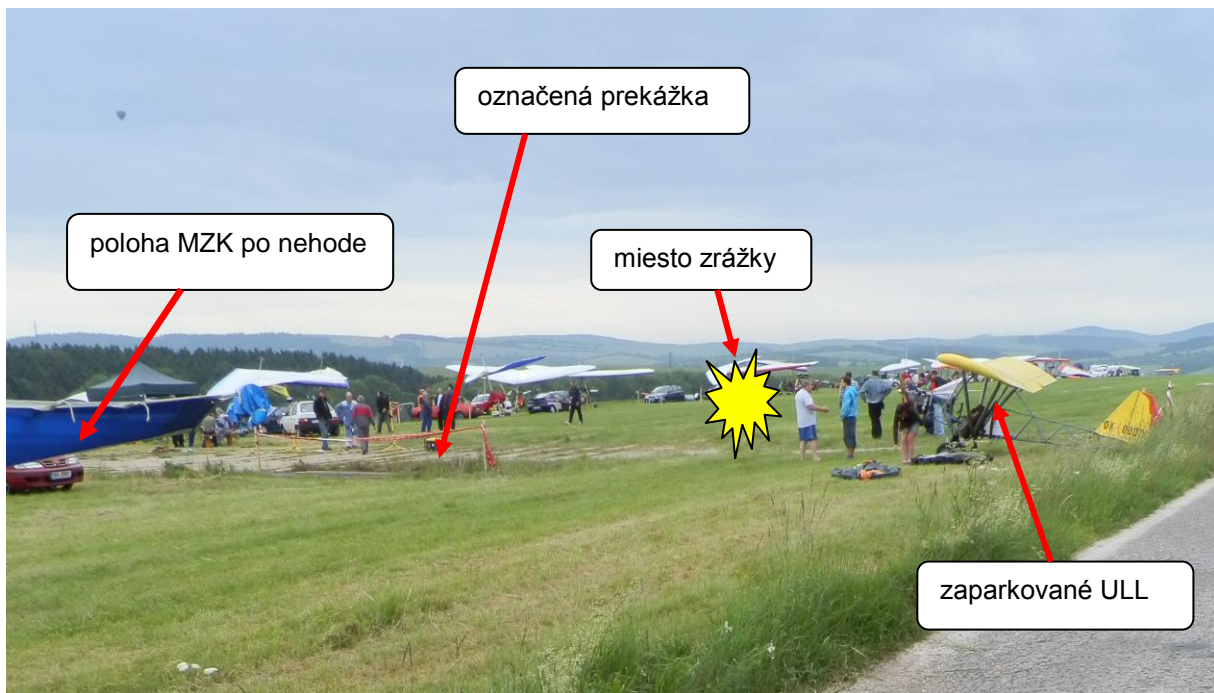
Približná situácia na mieste zrážky v čase udalosti