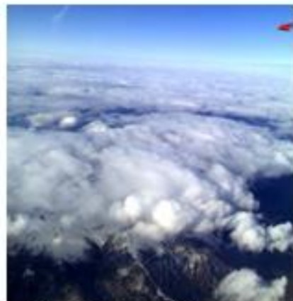
Obr. č.4 Severná vlna