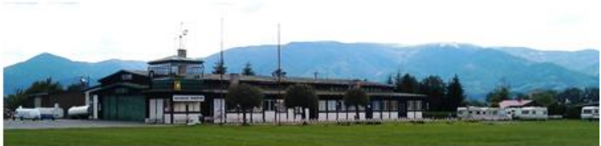
Obr. č.2 Hangár s pozadím Lúčanskej Malej Fatry - Martinkami