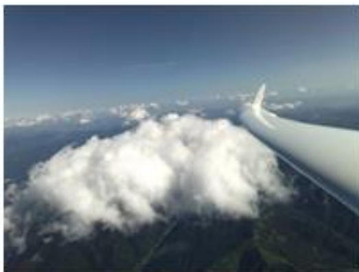
Obr. č.3 Pohľad na rotor severnej vlny