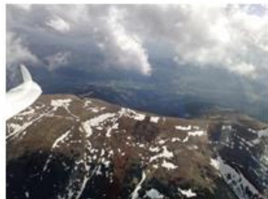
Obr. č.6 Kráľová Hoľa