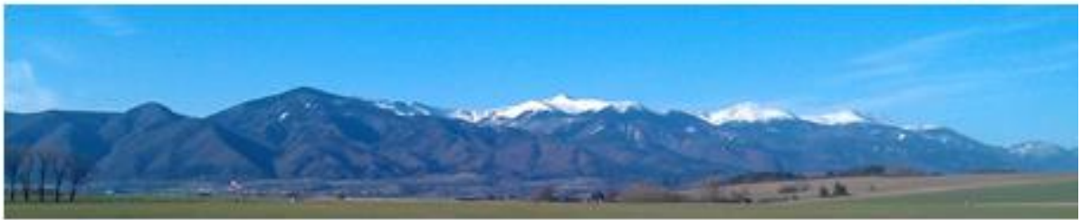
Obr. č.1 Krivánska Malá Fatra – ideálne podmienky pre termické a svahové lietanie