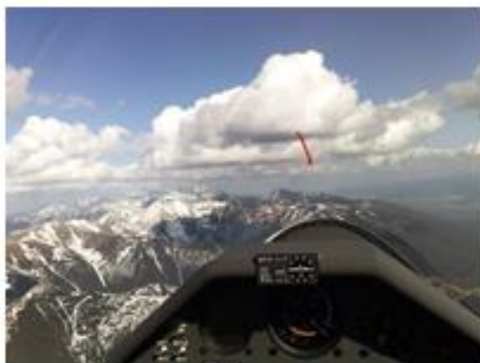
Obr. č.5 Liptovské Tatry