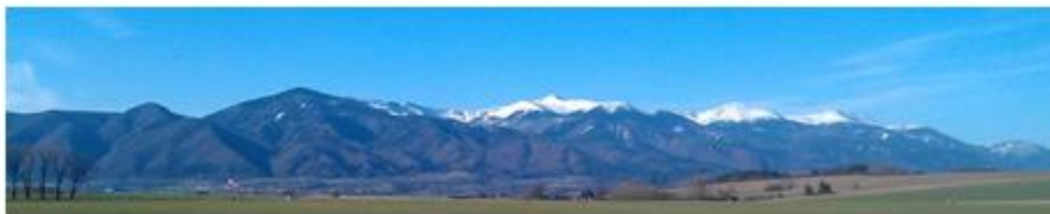
Obr. č.1 Krivánska Malá Fatra – ideálne podmienky pre termické a svahové lietanie