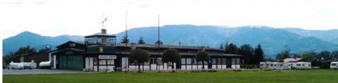
Obr. č.2 Hangár s pozadím Lúčanskej Malej Fatry - Martinkami