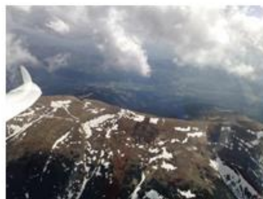
Obr. č.6 Kráľová Hoľa