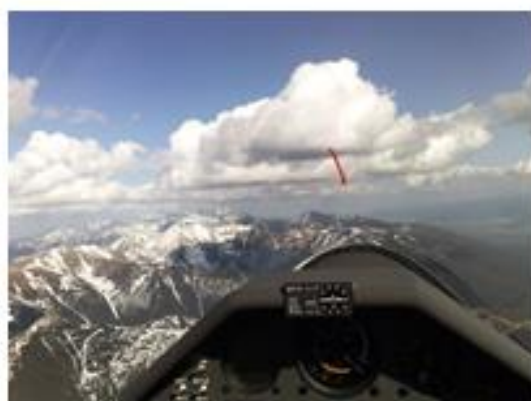
Obr. č.5 Liptovské Tatry