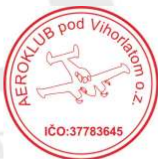
Arnošt FOFF za organizátora